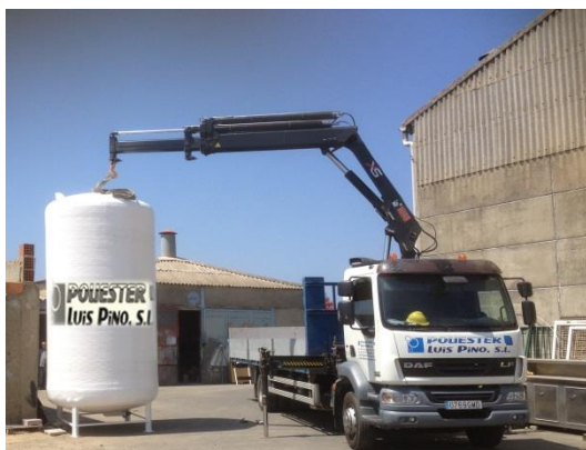
IMAGEN NO CONTRACTUAL