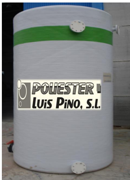
IMAGEN NO CONTRACTUAL