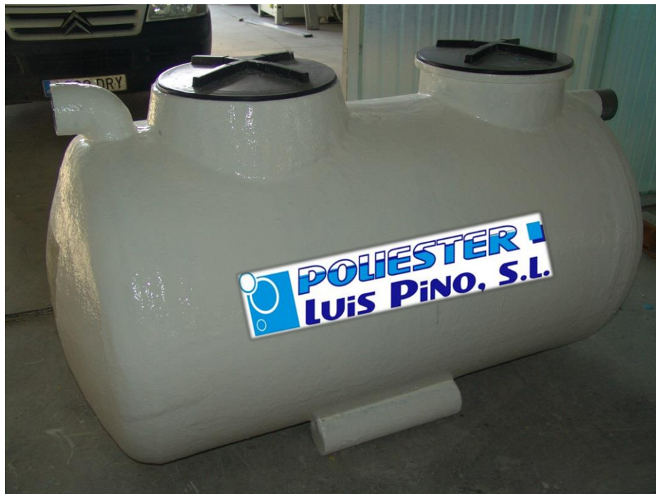
IMAGEN NO CONTRACTUAL